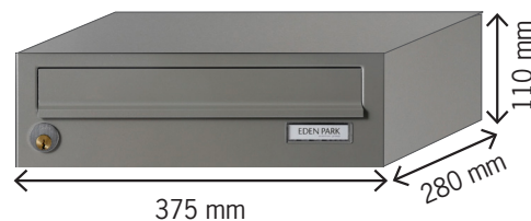
Liggende model (lav)