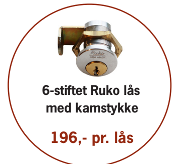
6-stiftet Ruko lås med kamstykke